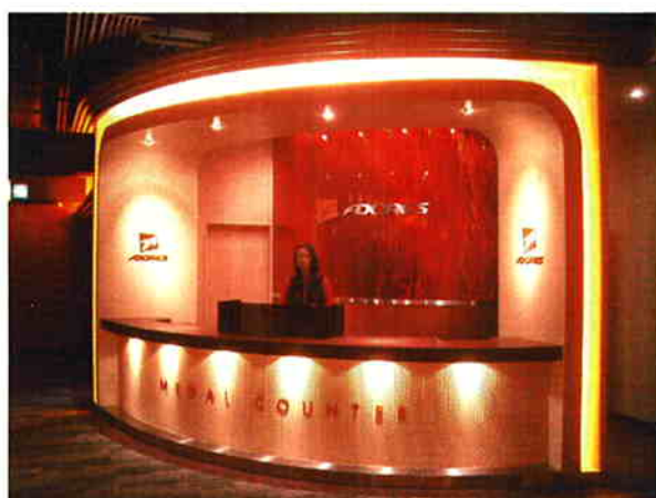
地下1階カウンター