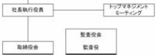
株ファンケル 組織図 2008年6月16日付