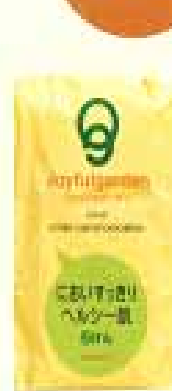
ジョイフルガーデン 石けん