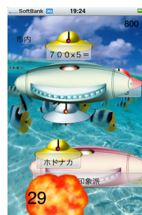
【声を利用したゲーム②】