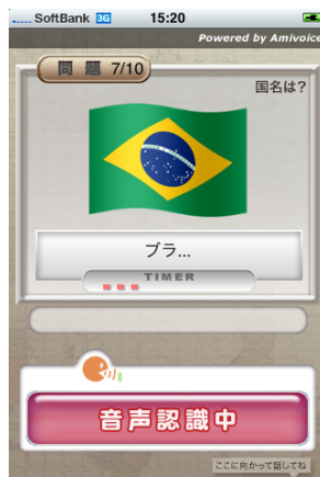
【声を利用したゲーム①】