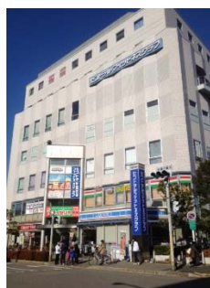
稲毛海岸駅前ビル