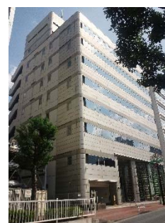
新宿区歌舞伎町ビル