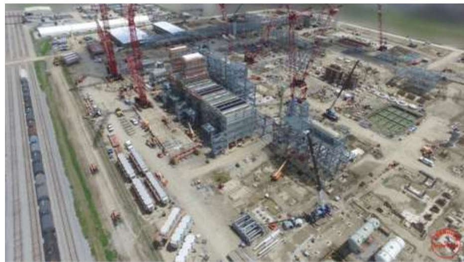
建設現場（2017年4月現在）