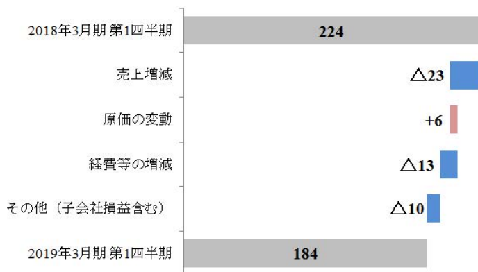
営業利益増減分析 (単位：億円)